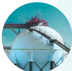
COMISIÓN DE SEGURIDAD DE EQUIPOS A PRESIÓN