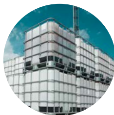
CTN 109 - SEGURIDAD EN EL ALMACENAMIENTO, MANIPULACIÓN Y PROCESOS CON PRODUCTOS QUÍMICOS