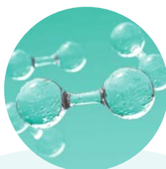
COMISIÓN DE SEGURIDAD DEL HIDRÓGENO