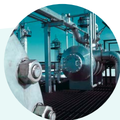
CTN 62 - BIENES DE EQUIPOS INDUSTRIALES Y A PRESIÓN

De este modo, en conexión con la actividad de nuestras Comisiones de Seguridad, gestionamos distintos órganos de normalización, para los que contamos con la contribución de los asociados de los distintos sectores industriales representados en BEQUINOR.