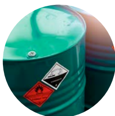
COMISIÓN DE SEGURIDAD DE ALMACENAMIENTO DE PRODUCTOS QUÍMICOS

En estas Comisiones de seguridad, ponemos en común el conocimiento y la experiencia de los profesionales altamente cualificados de empresas y entidades asociadas de toda la cadena de valor de distintos sectores industriales para analizar las mejores prácticas y soluciones de seguridad disponibles.