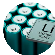
COMISIÓN DE SEGURIDAD DE BATERÍAS DE LITIO