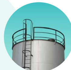
COMISIÓN DE SEGURIDAD DE INSTALACIONES PETROLÍFERAS

Haciendo Seguridad por una Industria Sostenible